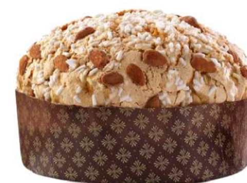
Foto del recubrimiento de ambos

Galup sin gluten clásico Con naranja y limón confitados y pasas. 400 g -24,50€