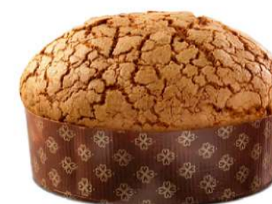
Foto recubrimiento avellanas